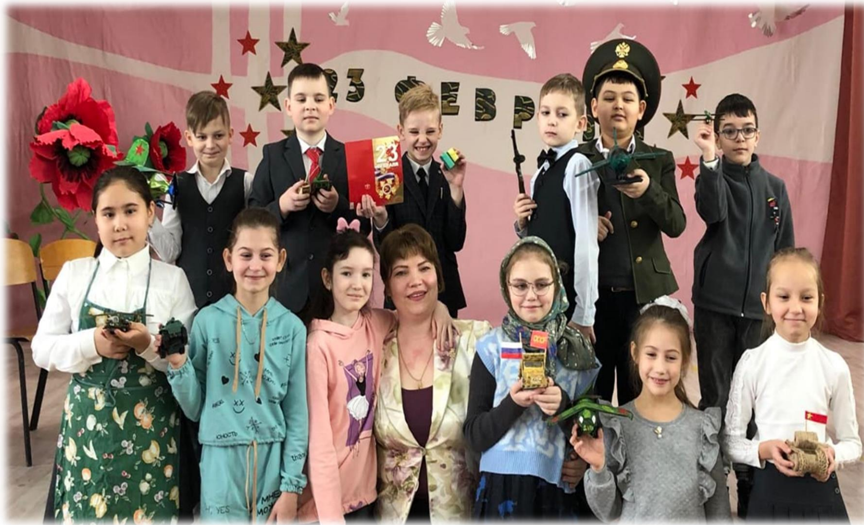
Театральная студия «Этюд»