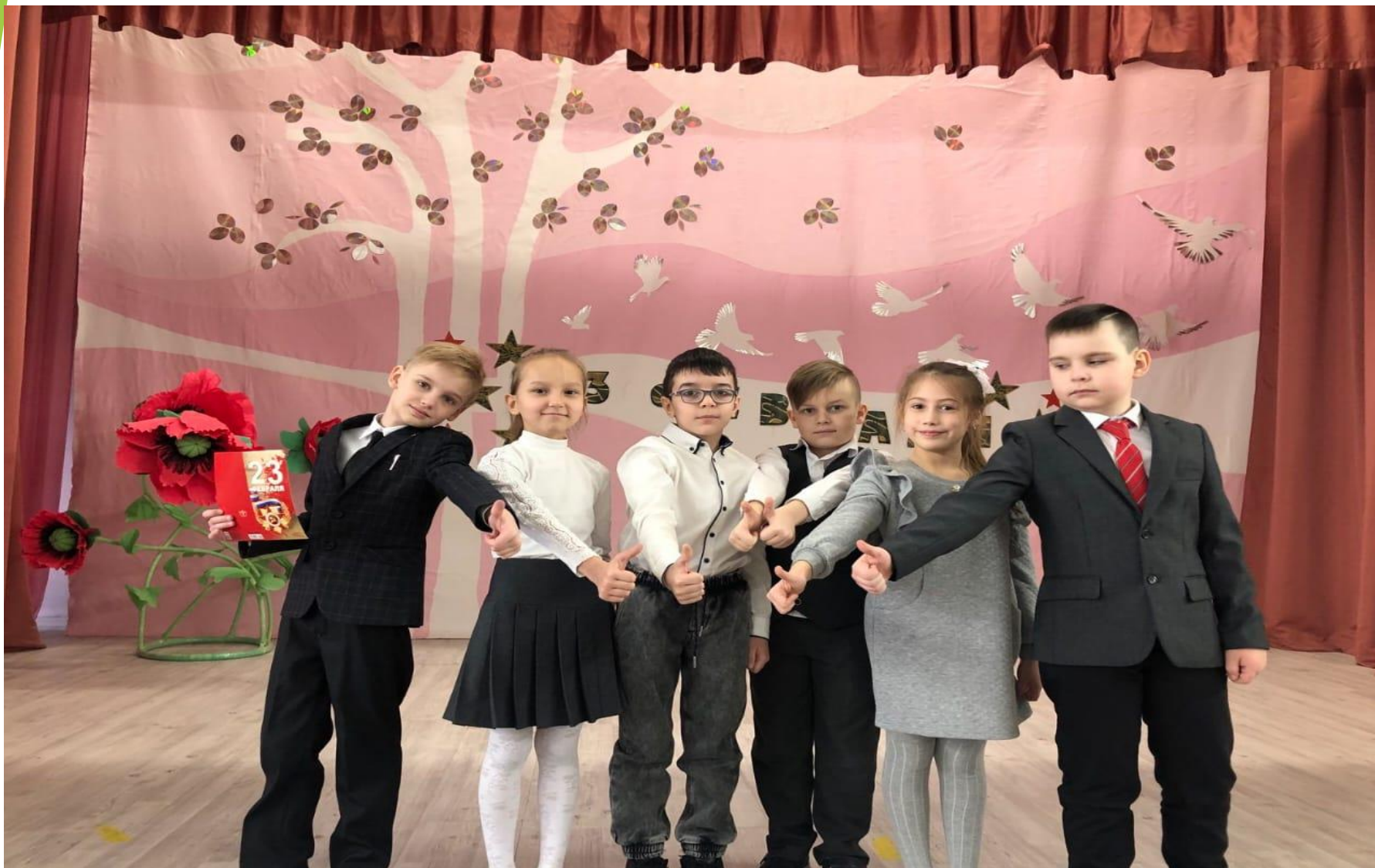
Игра «ДА-ДА-ДА – НЕТ-НЕТ-НЕТ».