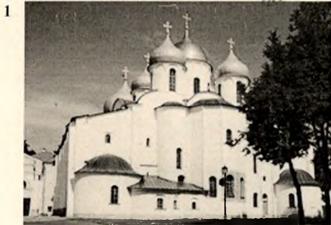
Святой Троицы Новосил сели Владислав

Назовите архитектурное сооружение, время постройки, архитектурный стиль и место, в котором находится сооружение (за каждый правильный ответ - 1 балл, максимальное количество баллов - 12):