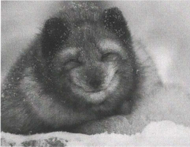
Песец ареал – Арктика

18. Пример какого экогеографического правила/закона выступают эти два представителя семейства Собачьих из различных регионов: