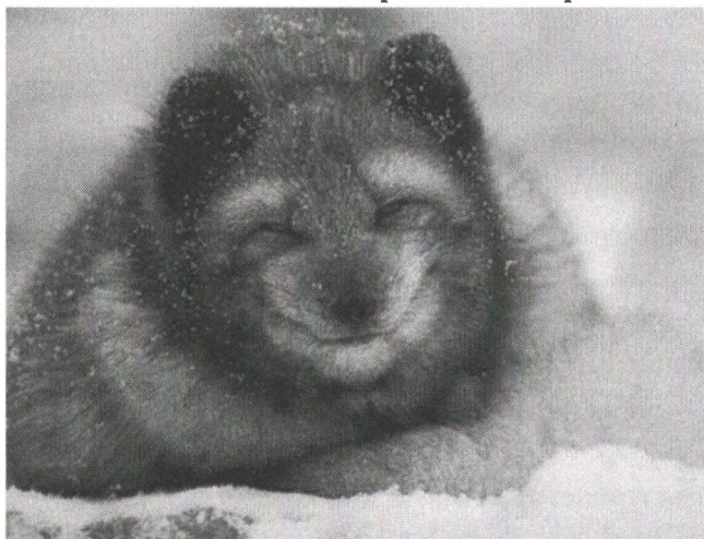
Песец Ареал – Арктика

1. Примером каких двух экогеографических правил выступают эти два представителя семейства Собачьих из различных регионов: