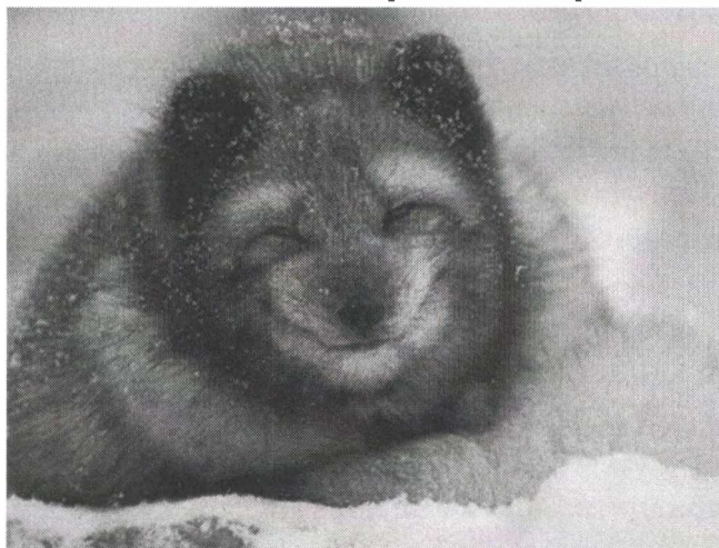
Песец Ареал – Арктика

1. Примером каких двух экогеографических правил выступают эти два представителя семейства Собачьих из различных регионов: