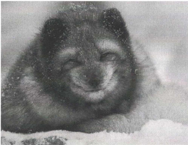
Песец Ареал – Арктика

1. Примером каких двух экогеографических правил выступают эти два представителя семейства Собачьих из различных регионов: