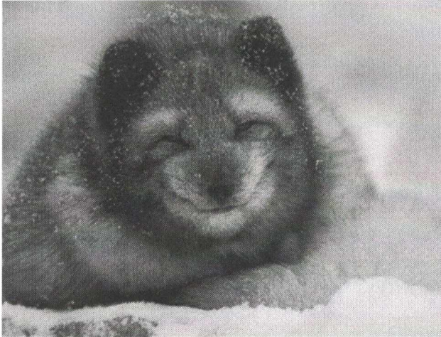
Песец ареал – Арктика

18. Пример какого экогеографического правила/закона выступают эти два представителя семейства Собачьих из различных регионов: