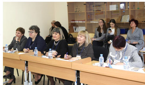
Жюри за работой

графический этюд. Конкурсантке удалось создать на занятии доброжелательную атмосферу и организовать комфортную образовательную среду.